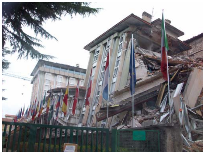
L'Hotel Duca degli Abruzzi!!!