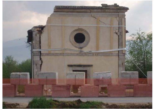
SEGNII DEL SISMA