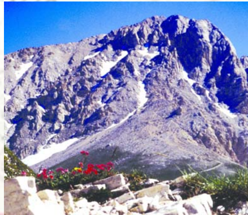
Corno Grande m 2912

Pomeriggio del primo giorno: da località "Fontanone" si percorre "Valle Donica" e per sentiero rigoglioso di vegetazione si giunge in una ora e trenta minuti al rifugio S. Pupa . (Primo tratto del sentiero n°20)