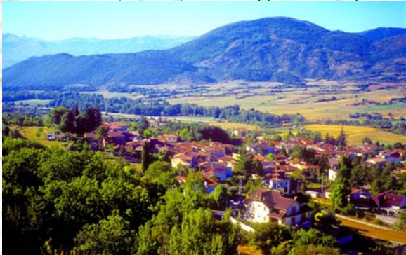
Barete (m. 800)

Il trekking ha inizio dall'abitato di Barete (L'Aquila), arriva a Prati di Tivo (Teramo) e si sviluppa in circa quattro giorni.