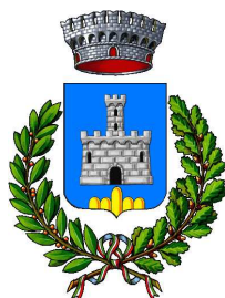
COMUNE di CASTEL DEL MONTE

CLUB ALPINO ITALIANO Sezione dell'Aquila 1874