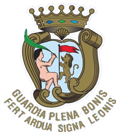
COMUNE di GUARDIAGRELE